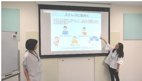
(ストレスマネジメント講座の様子)

発達障害者や家族、および支援者対象の支援プログラムの研究開発を行っています。R2年度は、就労移行支援者対象のストレスマネジメント講座や当事者向けの支援プログラムを行いました。当事者向けの支援プログラムでは、相談支援事業所（コミセン希望）と共同で、青年期の発達段階に配慮したコミュニケーション支援を行っています。当事者同士で自分たちの活動を企画してグループ活動を行うなど、訓練された場ではなく、自然な環境の場でコミュニケーション支援を試みています。