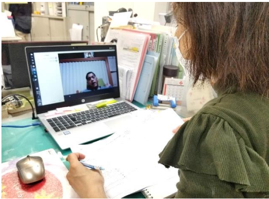
(リモートによる面談の様子)