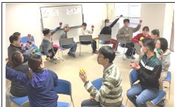
（新メニュー（「スポトレ」）の様子

その結果は、9月度 82.9 ポイント、3月度 82.4 ポイントとなりました。内容の分析として、今年度はコロナ禍により外出の機会が大幅に減少したものの、音楽運動活動（「スポトレ」）等の開始や、ネットスーパーの活用により利便性が向上したなどの意見が寄せられました。また、今年度はコロナ禍の影響で施設内で過ごす時間が増加したことにより、個々の身だしなみや整容、居室の整理整頓に関するニーズが増加したことが読み取れます。