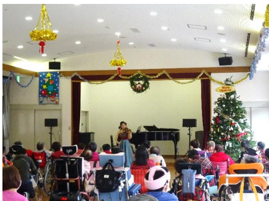
(ヴァイオリンコンサート)