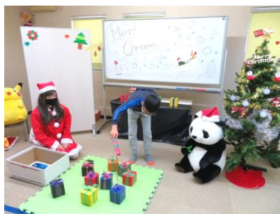
（クリスマス行事の様子）