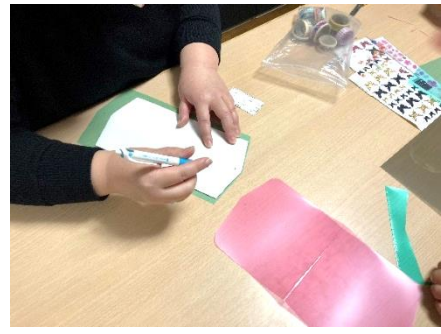
( マスクケース作り )