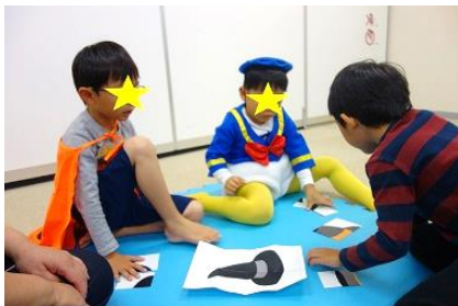
(10月ハロウィン行事)

新型コロナウイルス感染拡大予防のため、保護者参加型行事は全て中止になりましたが、季節行事は児童のみで実施し、その様子をホームページに定期的に掲載することにより、保護者との情報の共有を図りました。