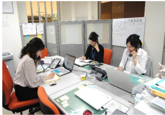
(電話による面談の様子)