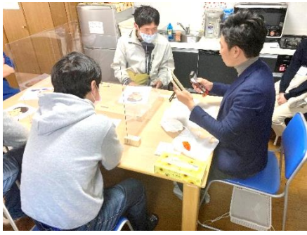
( 身だしなみ講座 ( 髭剃り ) )